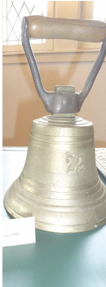
Ortsdiener mit der Schelle

Aus ihrer umfangreichen Fotosammlung hat die Historische Werkstatt Nordenstadt Bilder für eine Sonderausstellung zusammengestellt mit dem Titel "Norschter Leut' - früher und heut". Anhand der ca. 600 ausgestellten Bilder kann die Veränderung von einem durch Landwirtschaft geprägten kleinen Ort in der Nähe von Wiesbaden zu einem Stadtteil der Landeshauptstadt nachvollzogen werden. Diese Entwicklung vollzog sich seit 1945 mit der Aufnahme von Aussiedlern, wurde durch die Ausweisung neuer Wohngebiete und Gewerbeflächen in den 1970er und 1980er Jahren verstärkt und setzt sich mit dem neu entstehenden Wohngebiet Hainweg weiter fort. Sich orten, wo man wohnt, zuhause fühlen im Stadtteil, gilt für Alteingesessene wie Neubürger gleichermaßen. Die Sonderausstellung stellt die Menschen/Leut' in den Vordergrund und zeigt u.a. Fotos von Kindergarten, Schule, Ausflügen und Festen aller Art. Alte Fotos von Straßen und die aktuellen Vergleichsbilder zeigen die Veränderungen im Ortsbild. Passende Exponate aus dem Museum ergänzen die Fotos. Heimatmuseum Nordenstadt, Turmstraße 9-11, Wiesbaden-Nordenstadt geöffnet 1. und 3. Sonntag, 15 - 17 Uhr Tel.: 06122.14624 www.historische-werkstatt-nordenstadt.de